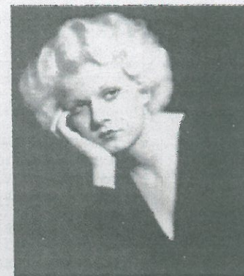
La actriz Jean Harlow.

La Tertulia de cine Perdiguier glosará hoy la carrera cinematográfica de la actriz Jean